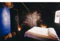
1993 Su barca di carta m'imbarco – Maria Lai (Stanza d'autore)