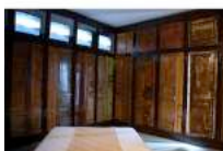
1992 La stanza del mare negato – Fabrizio Plessi (Stanza d'autore)