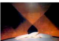
1993 La torre di Sigismundo – Raoul Ruiz (Stanza d'autore)