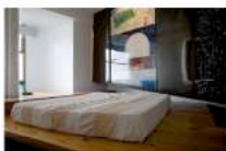
1992 Linea d'Ombra – Michele Canzoneri (Stanza d'autore)