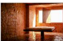
1996 Terra e Fuoco – Luigi Mainolfi (Stanza d'autore)